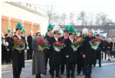
Barbórkowe msze święte