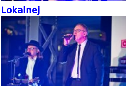
Otwarcie Centrum Usług Społecznościowych i Aktywności Lokalnej