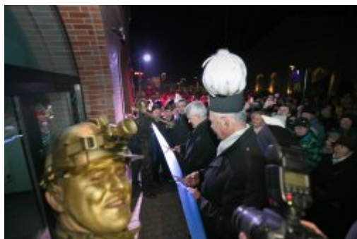
Uroczyste przecięcie wstęgi

Górnictwo Śląska i Zagłębia doszły do głosu w naszym mieście. Świętowaliśmy tak jak nakazuje dawny zwyczaj, ale nie obyło się bez niespodzianek.