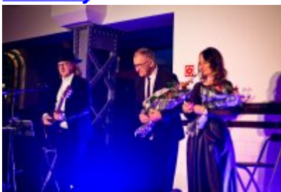
Otwarcie Centrum Usług Społecznościowych i Aktywności Lokalnej