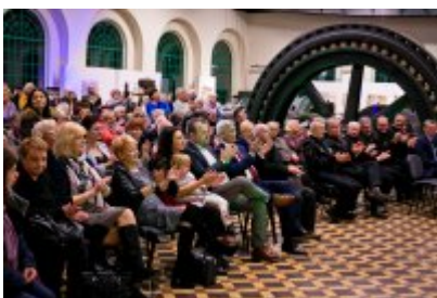
Otwarcie Centrum Usług Społecznościowych i Aktywności Lokalnej