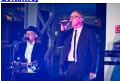
Otwarcie Centrum Usług Społecznościowych i Aktywności Lokalnej