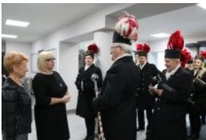
Barbórkowe msze święte