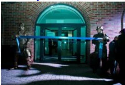
• Otwarcie Centrum Usług Społecznościowych i Aktywności Lokalnej