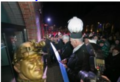
• Otwarcie Centrum Usług Społecznościowych i Aktywności Lokalnej