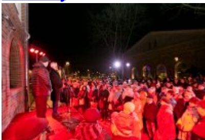
• Otwarcie Centrum Usług Społecznościowych i Aktywności Lokalnej