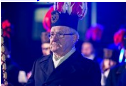
Otwarcie Centrum Usług Społecznościowych i Aktywności Lokalnej