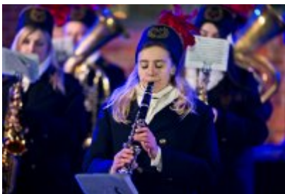
Otwarcie Centrum Usług Społecznościowych i Aktywności Lokalnej