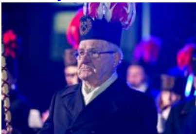
Otwarcie Centrum Usług Społecznościowych i Aktywności Lokalnej