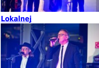
Otwarcie Centrum Usług Społecznościowych i Aktywności Lokalnej