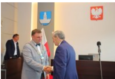
Pierwsza sesja Rady Miejskiej w Czeladzi w kadencji 2024-2029