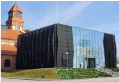
• Głosujemy na Cechownię