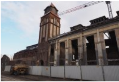
• Głosujemy na Cechownię