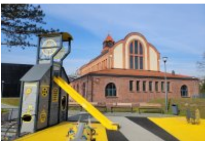
• Głosujemy na Cechownię