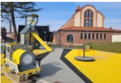
• Głosujemy na Cechownię