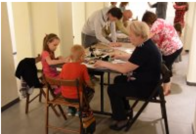
• Industriada 2017