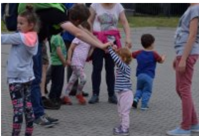
• Industriada 2017