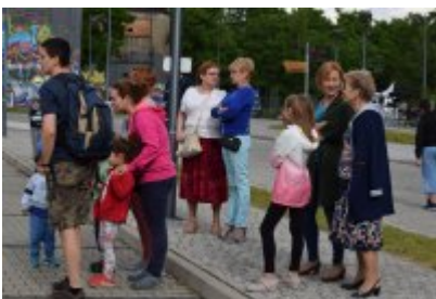
• Industriada 2017