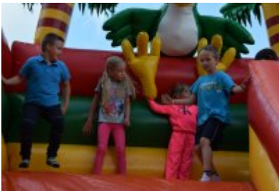
• Industriada 2017