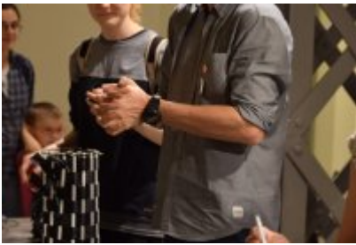
• Industriada 2017