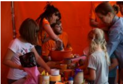
• Industriada 2017