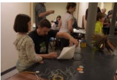
• Industriada 2017