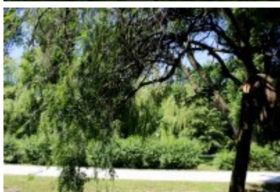
• Ścieżka przyrodniczo-dydaktyczna w Parku Kościuszki