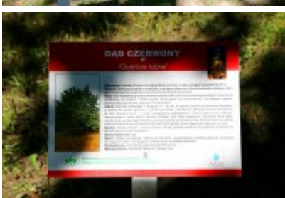
• Ścieżka przyrodniczo-dydaktyczna w Parku Kościuszki