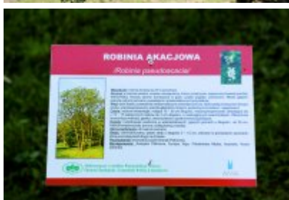
• Ścieżka przyrodniczo-dydaktyczna w Parku Kościuszki