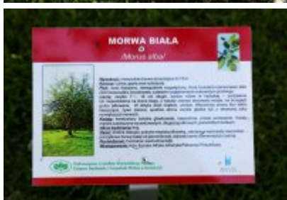
• Ścieżka przyrodniczo-dydaktyczna w Parku Kościuszki