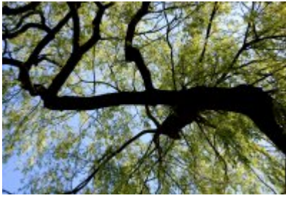
• Ścieżka przyrodniczo-dydaktyczna w Parku Kościuszki