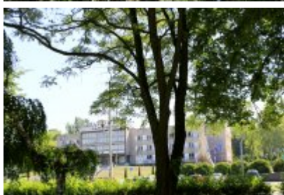
• Ścieżka przyrodniczo-dydaktyczna w Parku Kościuszki