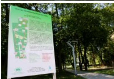
• Ścieżka przyrodniczo-dydaktyczna w Parku Kościuszki