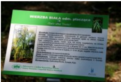
• Ścieżka przyrodniczo-dydaktyczna w Parku Kościuszki