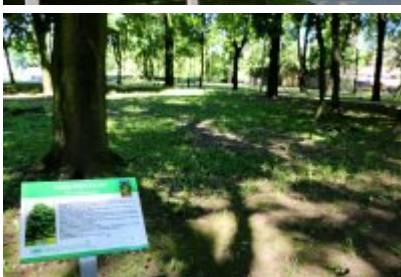
• Ścieżka przyrodniczo-dydaktyczna w Parku Kościuszki