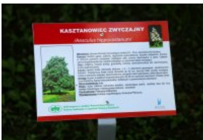
• Ścieżka przyrodniczo-dydaktyczna w Parku Kościuszki