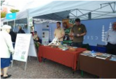
Czeladzkie "Senioralia" 2017