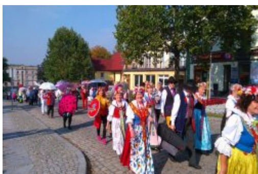
Marsz Parasolek podczas Czeladzkich „Senioraliów” 2017