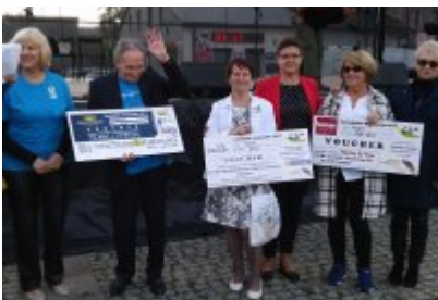
Czeladzkie "Senioralia" 2017