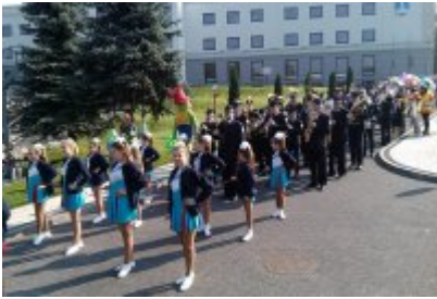
Czeladzkie "Senioralia" 2017