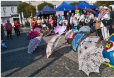
Czeladzkie "Senioralia" 2017