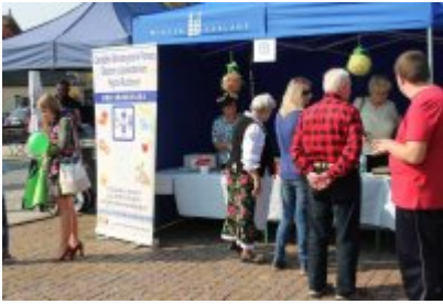
Czeladzkie "Senioralia" 2017