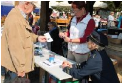
Czeladzkie "Senioralia" 2017