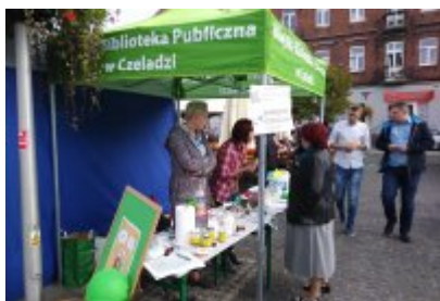
Czeladzkie "Senioralia" 2017