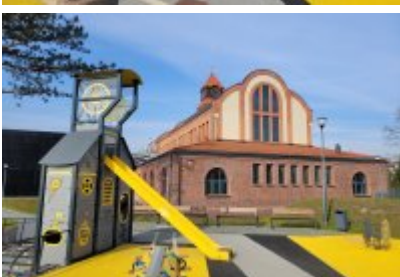
• Głosujemy na Cechownię