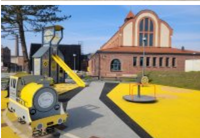
• Głosujemy na Cechownię