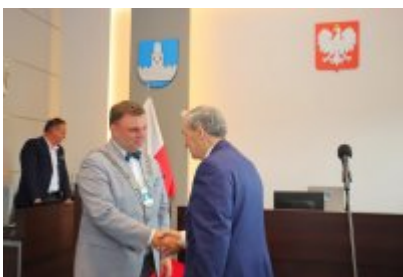
Pierwsza sesja Rady Miejskiej w Czeladzi w kadencji 2024-2029