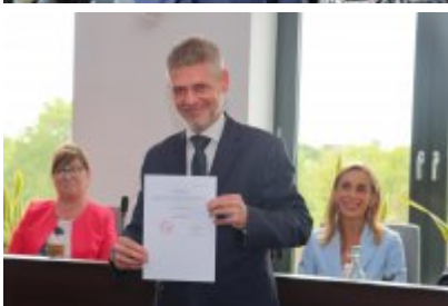
Pierwsza sesja Rady Miejskiej w Czeladzi w kadencji 2024-2029