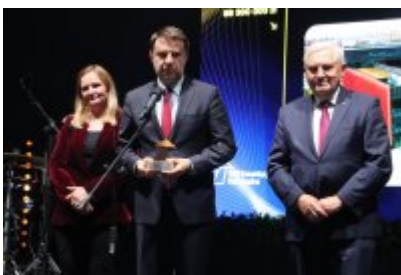
Gala Top Inwestycje Komunalne 2024