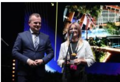
Gala Top Inwestycje Komunalne 2024