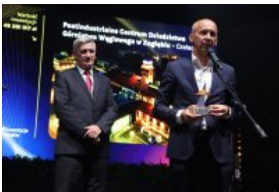
Gala Top Inwestycje Komunalne 2024