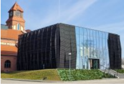
• Głosujemy na Cechownię