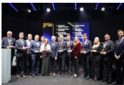
Gala Top Inwestycje Komunalne 2024