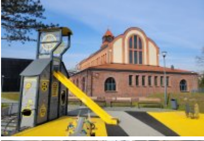
• Głosujemy na Cechownię