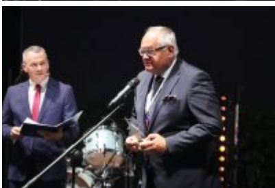
Gala Top Inwestycje Komunalne 2024