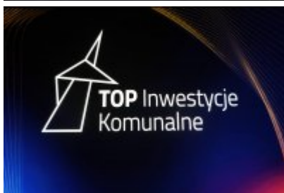
Gala Top Inwestycje Komunalne 2024