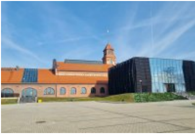
• Głosujemy na Cechownię