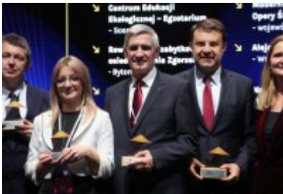
Gala Top Inwestycje Komunalne 2024