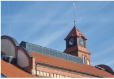
• Głosujemy na Cechownię