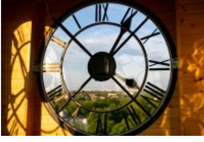
• Głosujemy na Cechownię