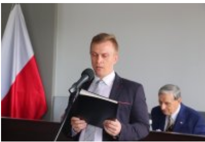
Pierwsza sesja Rady Miejskiej w Czeladzi w kadencji 2024-2029