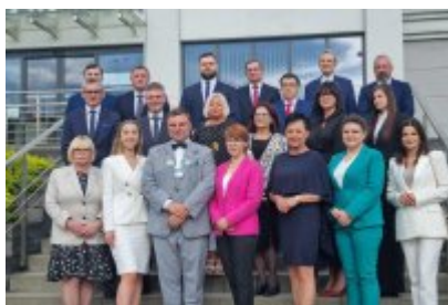
Pierwsza sesja Rady Miejskiej w Czeladzi w kadencji 2024-2029