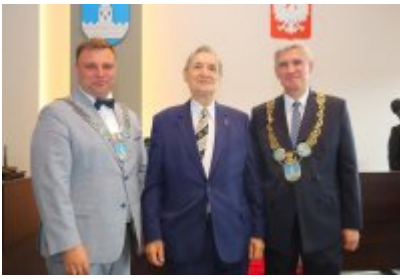
Pierwsza sesja Rady Miejskiej w Czeladzi w kadencji 2024-2029