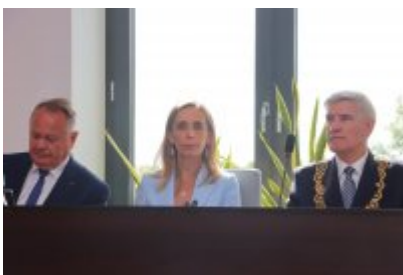
Pierwsza sesja Rady Miejskiej w Czeladzi w kadencji 2024-2029