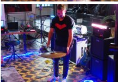
• Industriada 2021