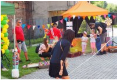
• Industriada 2021