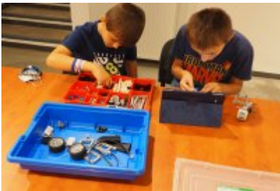
• Industriada 2021