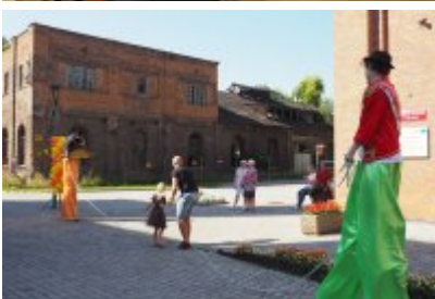
• Industriada 2021