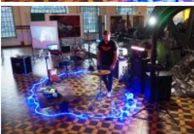
• Industriada 2021