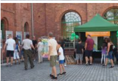
• Industriada 2021