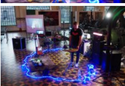
• Industriada 2021