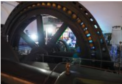
• Industriada 2021