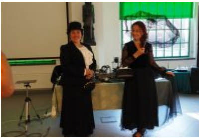
• Industriada 2021