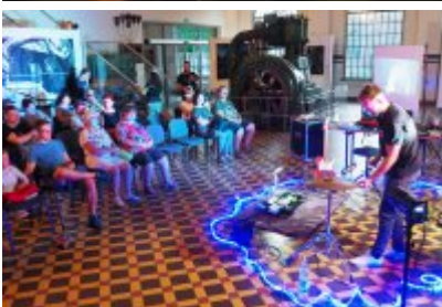
• Industriada 2021