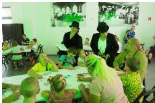
Industriada 2021 w Czeladzi

W sobotę, 11 września, w całym województwie fani techniki mieli swoje święto. Wszystko za sprawą Industriady, która co roku cieszy się ogromnym zainteresowaniem. Nie inaczej było w Czeladzi.