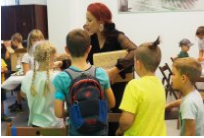
• Industriada 2021