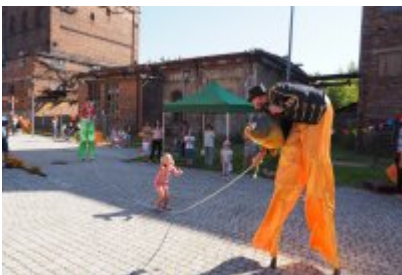
• Industriada 2021