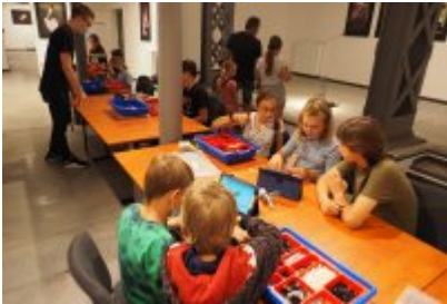
• Industriada 2021