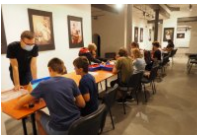
• Industriada 2021