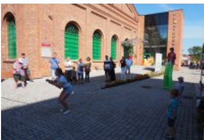
• Industriada 2021