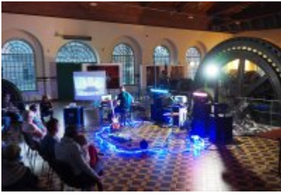
• Industriada 2021