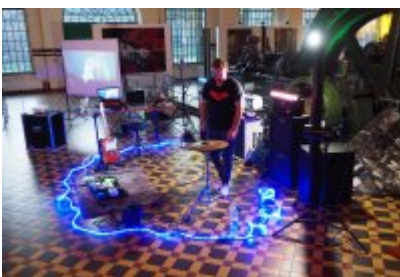
• Industriada 2021