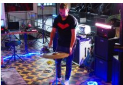
• Industriada 2021