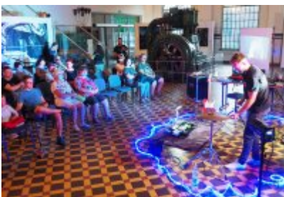
• Industriada 2021