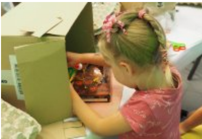
• Industriada 2021