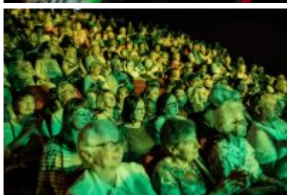
XXV Festiwal Ave - Kopalnia Kultury