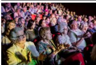
XXV Festiwal Ave - Kopalnia Kultury