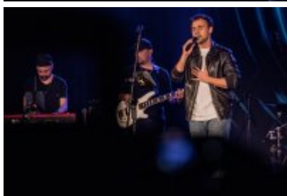
XXV Festiwal Ave - Kopalnia Kultury