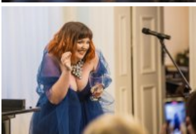
• XXV Festiwal Ave - Muzeum Saturn