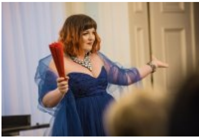
• XXV Festiwal Ave - Muzeum Saturn