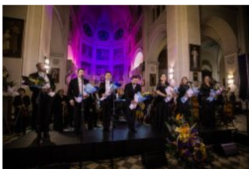
Festiwal Ave Maria