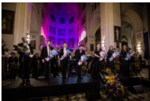
Festiwal Ave Maria