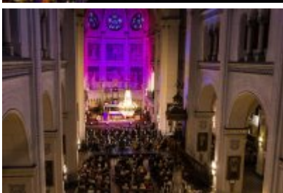
• XXV Festiwal Ave - kościół św. Stanisława