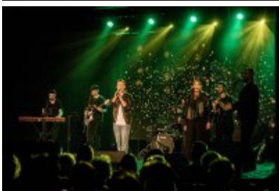
• XXV Festiwal Ave - Kopalnia Kultury