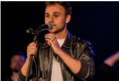
• XXV Festiwal Ave - Kopalnia Kultury