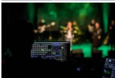
XXV Festiwal Ave - Kopalnia Kultury