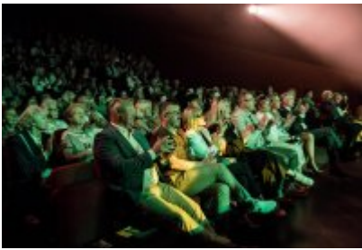
• XXV Festiwal Ave - Kopalnia Kultury