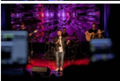
• XXV Festiwal Ave - Kopalnia Kultury