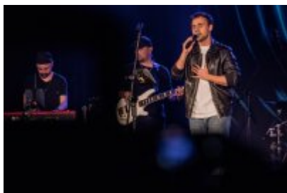
XXV Festiwal Ave - Kopalnia Kultury