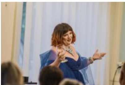
• XXV Festiwal Ave - Muzeum Saturn