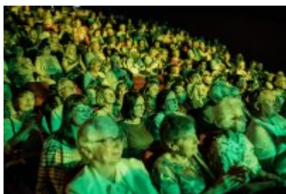
XXV Festiwal Ave - Kopalnia Kultury