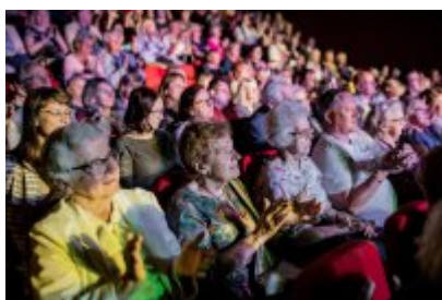
XXV Festiwal Ave - Kopalnia Kultury