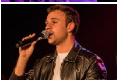
• XXV Festiwal Ave - Kopalnia Kultury