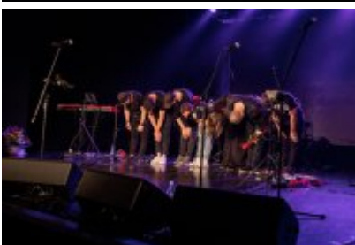
• XXV Festiwal Ave - Kopalnia Kultury