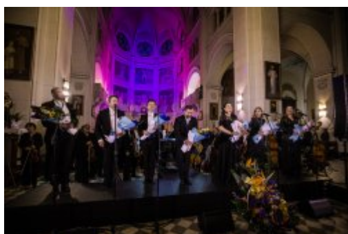
Festiwal Ave Maria