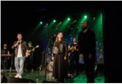
• XXV Festiwal Ave - Kopalnia Kultury