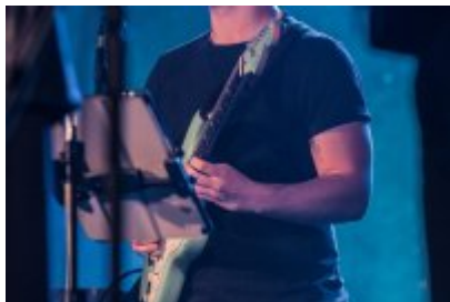
XXV Festiwal Ave - Kopalnia Kultury