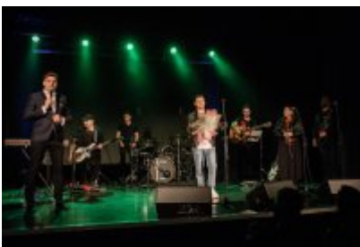
• XXV Festiwal Ave - Kopalnia Kultury