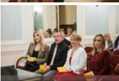
• XXV Festiwal Ave - Muzeum Saturn