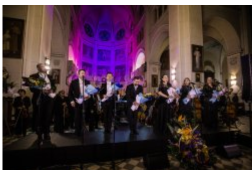
Festiwal Ave Maria