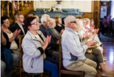
• XXV Festiwal Ave - Muzeum Saturn