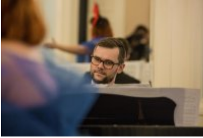
• XXV Festiwal Ave - Muzeum Saturn