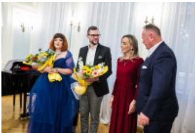
• XXV Festiwal Ave - Muzeum Saturn