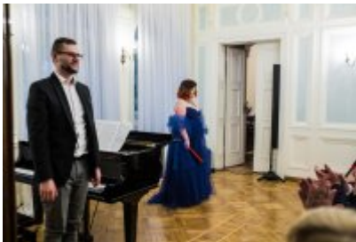
• XXV Festiwal Ave - Muzeum Saturn