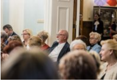
• XXV Festiwal Ave - Muzeum Saturn