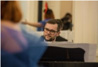
• XXV Festiwal Ave - Muzeum Saturn