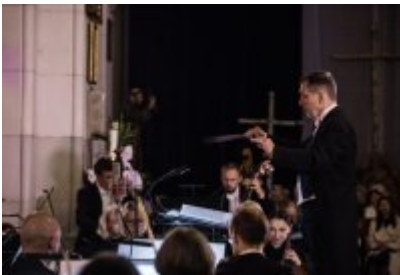
• XXV Festiwal Ave - kościół św. Stanisława