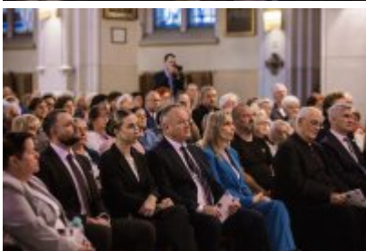
• XXV Festiwal Ave - kościół św. Stanisława