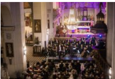
• XXV Festiwal Ave - kościół św. Stanisława