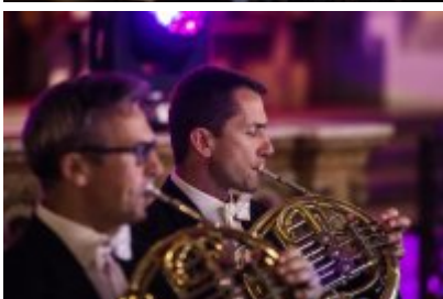
• XXV Festiwal Ave - kościół św. Stanisława