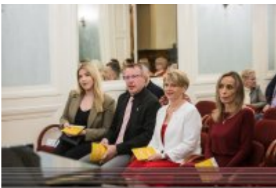
• XXV Festiwal Ave - Muzeum Saturn