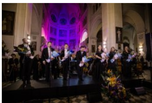
Festiwal Ave Maria