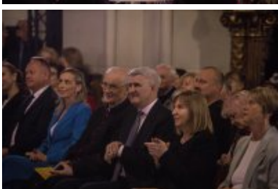
• XXV Festiwal Ave - kościół św. Stanisława