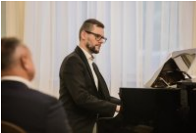
• XXV Festiwal Ave - Muzeum Saturn