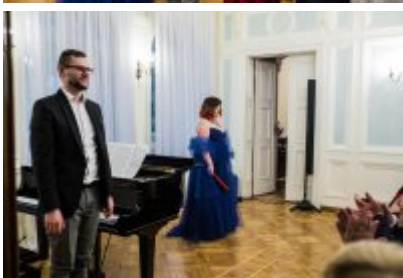
• XXV Festiwal Ave - Muzeum Saturn