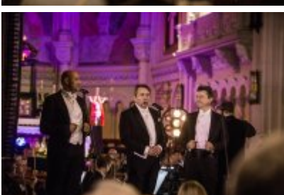
• XXV Festiwal Ave - kościół św. Stanisława