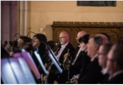
• XXV Festiwal Ave - kościół św. Stanisława