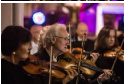
• XXV Festiwal Ave - kościół św. Stanisława