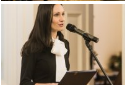
• XXV Festiwal Ave - Muzeum Saturn