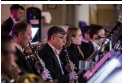
• XXV Festiwal Ave - kościół św. Stanisława