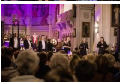
• XXV Festiwal Ave - kościół św. Stanisława