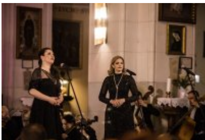
• XXV Festiwal Ave - kościół św. Stanisława