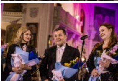
• XXV Festiwal Ave - kościół św. Stanisława