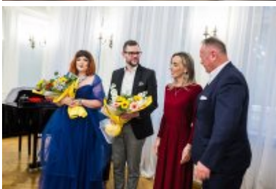
• XXV Festiwal Ave - Muzeum Saturn