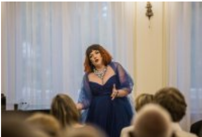
• XXV Festiwal Ave - Muzeum Saturn