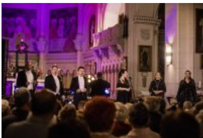
• XXV Festiwal Ave - kościół św. Stanisława