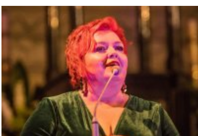
• XXV Festiwal Ave - kościół św. Stanisława