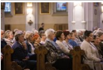
• XXV Festiwal Ave - kościół św. Stanisława