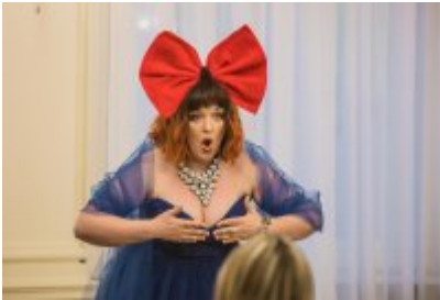
• XXV Festiwal Ave - Muzeum Saturn