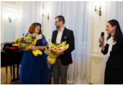
• XXV Festiwal Ave - Muzeum Saturn