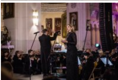
• XXV Festiwal Ave - kościół św. Stanisława