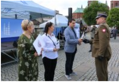
Dzień Weterana Działań Poza Granicami Państwa cz. 2