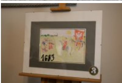
Dzień Weterana Działań Poza Granicami Państwa cz. 2