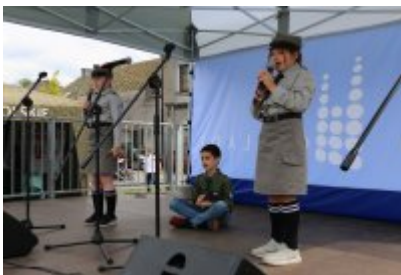
Dzień Weterana Działań Poza Granicami Państwa