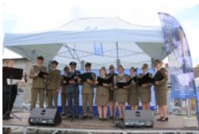
Dzień Weterana Działań Poza Granicami Państwa cz. 2