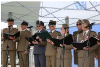
Dzień Weterana Działań Poza Granicami Państwa cz. 2