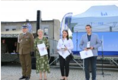
Dzień Weterana Działań Poza Granicami Państwa cz. 2