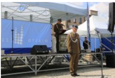
Dzień Weterana Działań Poza Granicami Państwa