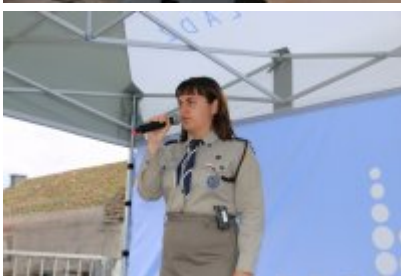
Dzień Weterana Działań Poza Granicami Państwa