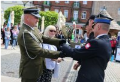
Dzień Weterana Działań Poza Granicami Państwa