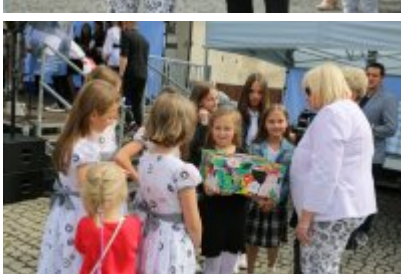
Dzień Weterana Działań Poza Granicami Państwa