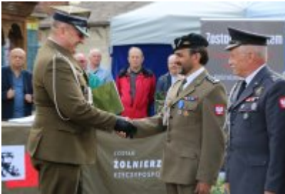
Dzień Weterana Działań Poza Granicami Państwa