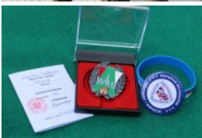
Dzień Weterana Działań Poza Granicami Państwa cz. 2