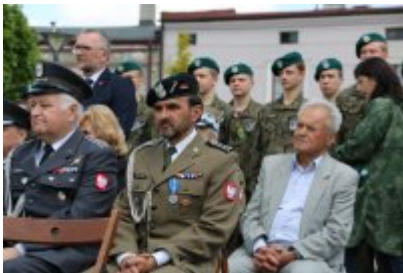
Dzień Weterana Działań Poza Granicami Państwa