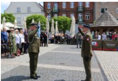
Dzień Weterana Działań Poza Granicami Państwa cz. 2