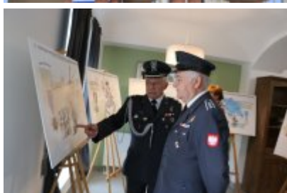
Dzień Weterana Działań Poza Granicami Państwa cz. 2