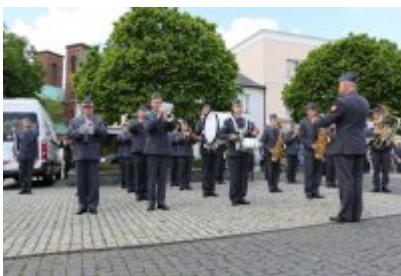
Dzień Weterana Działań Poza Granicami Państwa cz. 2