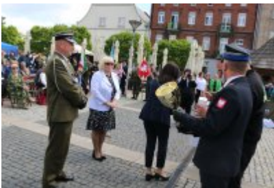
Dzień Weterana Działań Poza Granicami Państwa