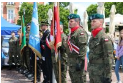
Dzień Weterana Działań Poza Granicami Państwa