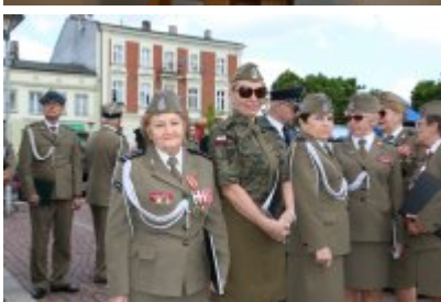
Dzień Weterana Działań Poza Granicami Państwa cz. 2