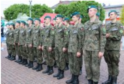
Dzień Weterana Działań Poza Granicami Państwa