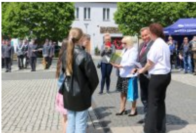
Dzień Weterana Działań Poza Granicami Państwa