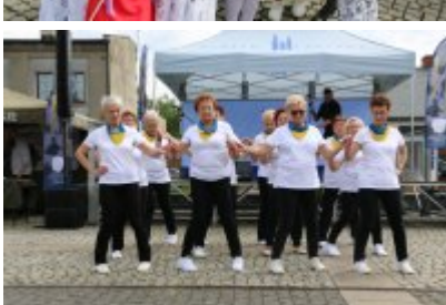
Dzień Weterana Działań Poza Granicami Państwa