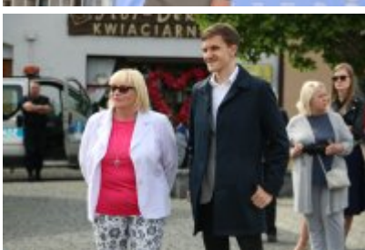
Dzień Weterana Działań Poza Granicami Państwa