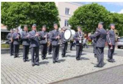
Dzień Weterana Działań Poza Granicami Państwa cz. 2