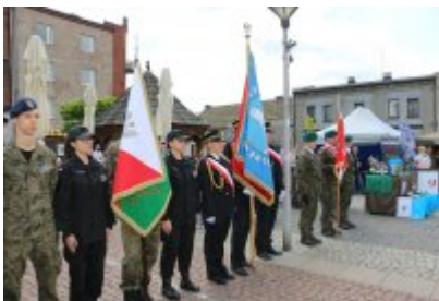
Dzień Weterana Działań Poza Granicami Państwa