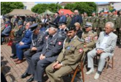
Dzień Weterana Działań Poza Granicami Państwa