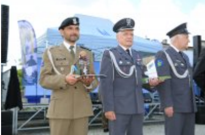
Dzień Weterana Działań Poza Granicami Państwa