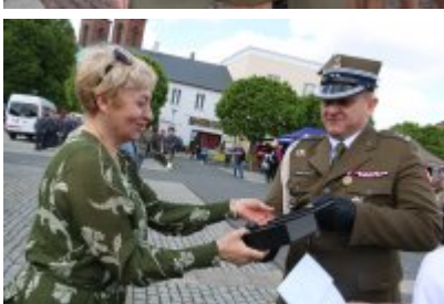
Dzień Weterana Działań Poza Granicami Państwa cz. 2