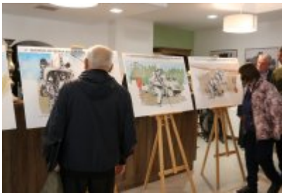
Dzień Weterana Działań Poza Granicami Państwa cz. 2