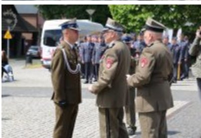
Dzień Weterana Działań Poza Granicami Państwa cz. 2