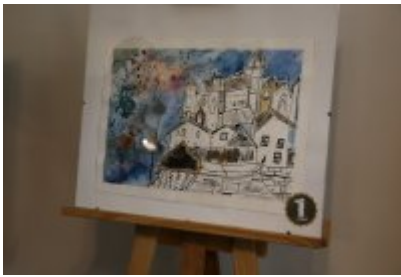
Dzień Weterana Działań Poza Granicami Państwa cz. 2