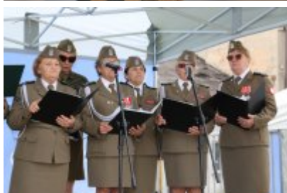
Dzień Weterana Działań Poza Granicami Państwa cz. 2