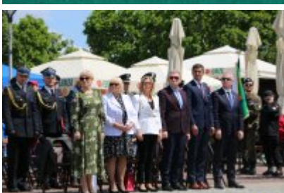
Dzień Weterana Działań Poza Granicami Państwa cz. 2