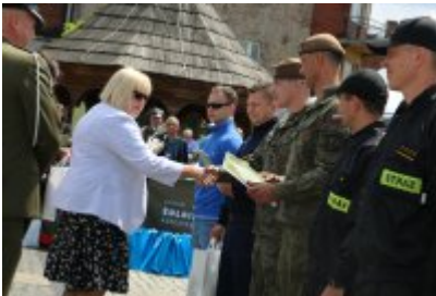
Dzień Weterana Działań Poza Granicami Państwa