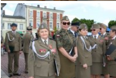
Dzień Weterana Działań Poza Granicami Państwa cz. 2