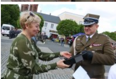
Dzień Weterana Działań Poza Granicami Państwa cz. 2