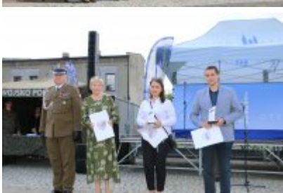
Dzień Weterana Działań Poza Granicami Państwa cz. 2