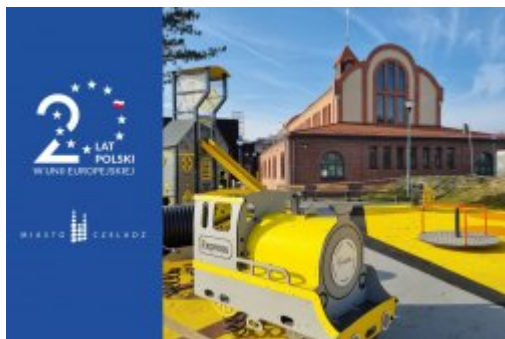
Majówka na Saturnie

1 maja świętujemy 20. rocznicę przystąpienia Polski do Unii Europejskiej! Z tej okazji zapraszamy na wyjątkowe wydarzenie, którym niewątpliwie będzie „Majówka na Saturnie”!