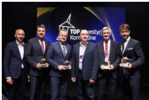
Top Inwestycje Komunalne

Miasto Czeladź zostało wyróżnione i znalazło się w pierwszej dziesiątce w prestiżowym konkursie Top Inwestycje Komunalne 2024.