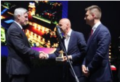
Gala Top Inwestycje Komunalne 2024