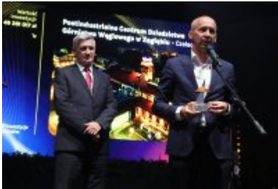
Gala Top Inwestycje Komunalne 2024