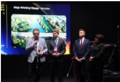
Gala Top Inwestycje Komunalne 2024