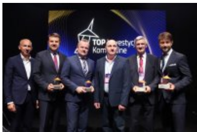
Gala Top Inwestycje Komunalne 2024