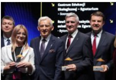
Gala Top Inwestycje Komunalne 2024