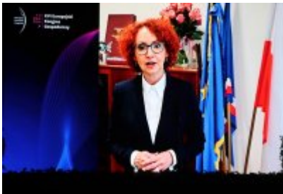
Gala Top Inwestycje Komunalne 2024