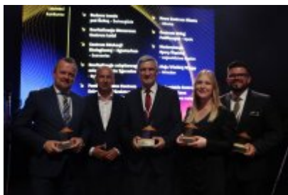
Gala Top Inwestycje Komunalne 2024