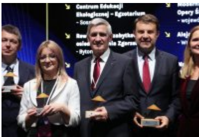
Gala Top Inwestycje Komunalne 2024