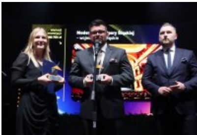
Gala Top Inwestycje Komunalne 2024