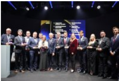
Gala Top Inwestycje Komunalne 2024