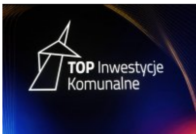
Gala Top Inwestycje Komunalne 2024