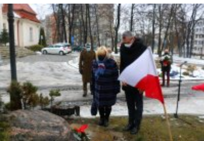
• 76. rocznica powrotu dzieci z Poltulic