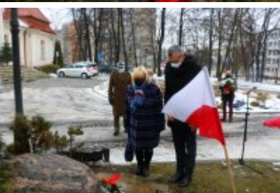
• 76. rocznica powrotu dzieci z Poltulic