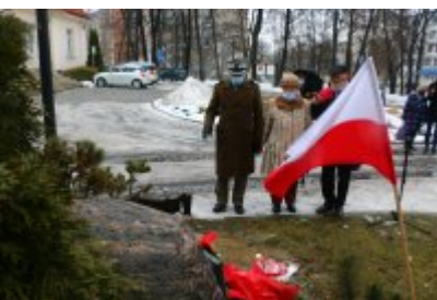
• 76. rocznica powrotu dzieci z Poltulic