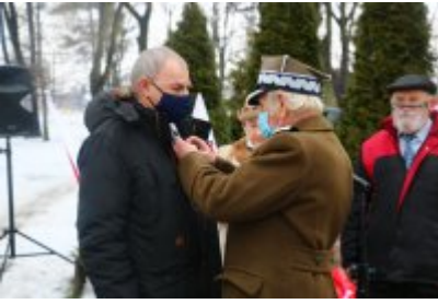
• 76. rocznica powrotu dzieci z Poltulic