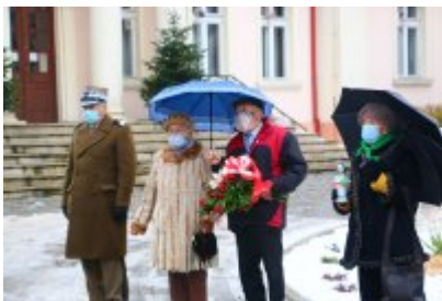
• 76. rocznica powrotu dzieci z Poltulic