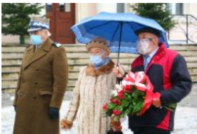
• 76. rocznica powrotu dzieci z Poltulic