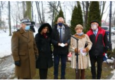
• 76. rocznica powrotu dzieci z Poltulic