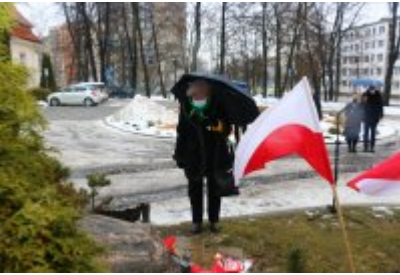
• 76. rocznica powrotu dzieci z Poltulic