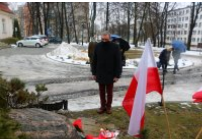
• 76. rocznica powrotu dzieci z Poltulic