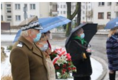
• 76. rocznica powrotu dzieci z Poltulic