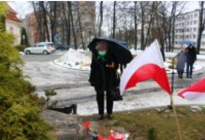
• 76. rocznica powrotu dzieci z Poltulic