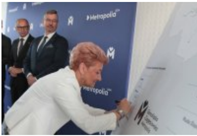
• Podpisanie porozumienia o budowie велоstrad w GZM