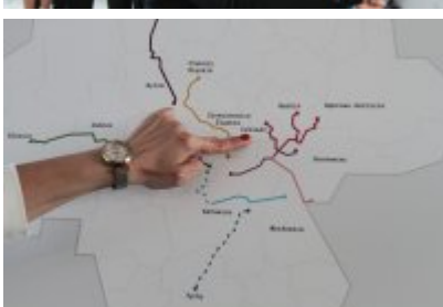
• Podpisanie porozumienia o budowie велоstrad w GZM