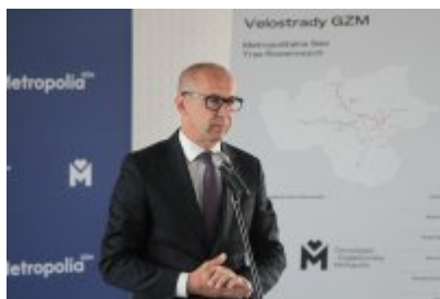
Podpisanie porozumienia o budowie velostrad w GZM