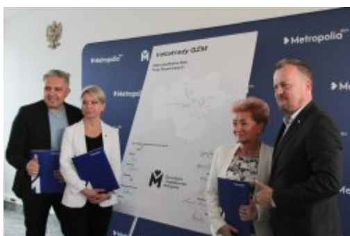
120 km Velostrad w GZM

W Katowicach przedstawiciele 11 samorządów podpisali w piątek (20 maja) porozumienia o rozpoczęciu budowy szybkich dróg rowerowych w GZM. Łącznie powstanie 8 velostrad o długości ok. 120 km.