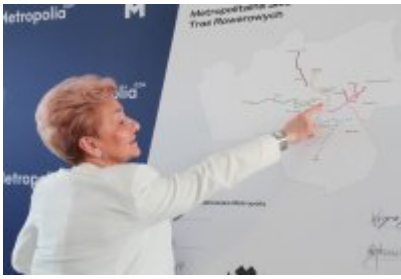
• Podpisanie porozumienia o budowie велоstrad w GZM