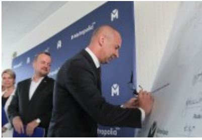
• Podpisanie porozumienia o budowie велоstrad w GZM