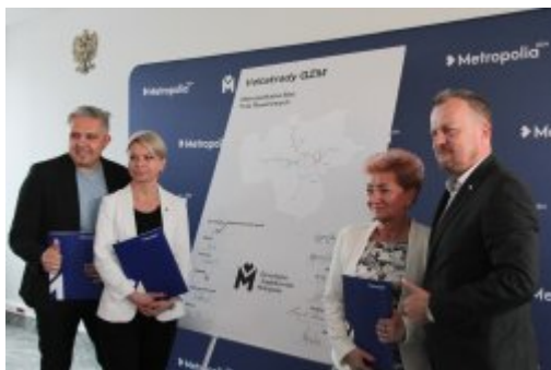
120 km Velostrad w GZM

W Katowicach przedstawiciele 11 samorządów podpisali w piątek (20 maja) porozumienia o rozpoczęciu budowy szybkich dróg rowerowych w GZM. Łącznie powstanie 8 velostrad o długości ok. 120 km.