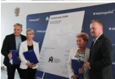
• Podpisanie porozumienia o budowie велоstrad w GZM