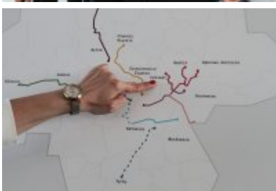
• Podpisanie porozumienia o budowie велоstrad w GZM