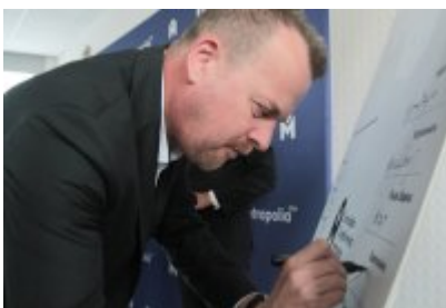
• Podpisanie porozumienia o budowie велоstrad w GZM