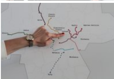
• Podpisanie porozumienia o budowie велоstrad w GZM