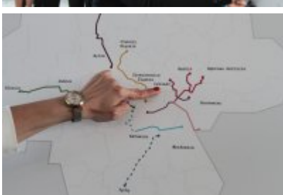
• Podpisanie porozumienia o budowie велоstrad w GZM