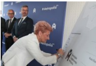
• Podpisanie porozumienia o budowie велоstrad w GZM