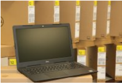
Komputery dla czeladzkich uczniów