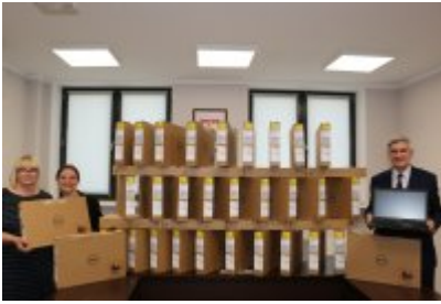
Komputery dla czeladzkich uczniów