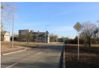
• Obwodnica osiedla Piłsudskiego w Czeladzi