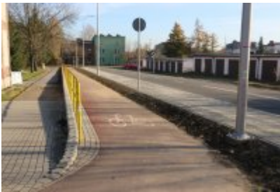
• Obwodnica osiedla Piłsudskiego w Czeladzi