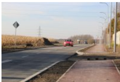
Obwodnica osiedla Piłsudskiego w Czeladzi