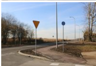
Obwodnica osiedla Piłsudskiego w Czeladzi