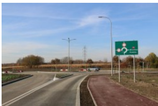
Obwodnica osiedla Piłsudskiego