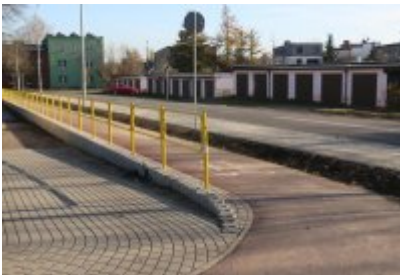
• Obwodnica osiedla Piłsudskiego w Czeladzi