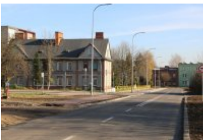
• Obwodnica osiedla Piłsudskiego w Czeladzi