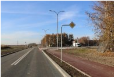
• Obwodnica osiedla Piłsudskiego w Czeladzi