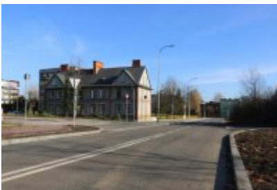
• Obwodnica osiedla Piłsudskiego w Czeladzi