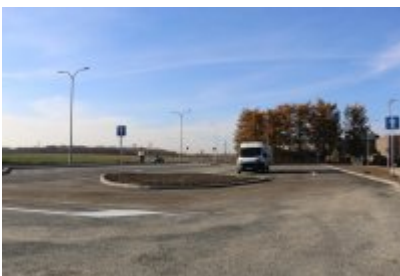
• Obwodnica osiedla Piłsudskiego w Czeladzi