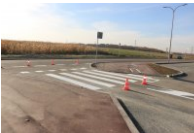
• Obwodnica osiedla Piłsudskiego w Czeladzi