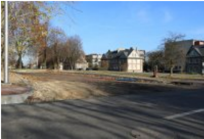
• Obwodnica osiedla Piłsudskiego w Czeladzi