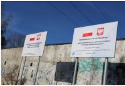
• Obwodnica osiedla Piłsudskiego w Czeladzi