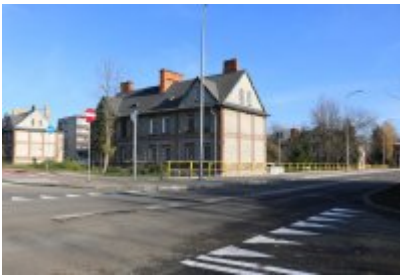
• Obwodnica osiedla Piłsudskiego w Czeladzi