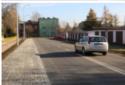
Obwodnica osiedla Piłsudskiego w Czeladzi