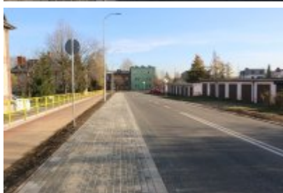
Obwodnica osiedla Piłsudskiego w Czeladzi