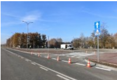
• Obwodnica osiedla Piłsudskiego w Czeladzi