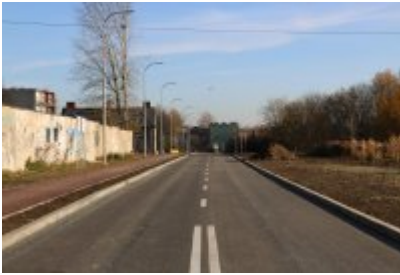
• Obwodnica osiedla Piłsudskiego w Czeladzi