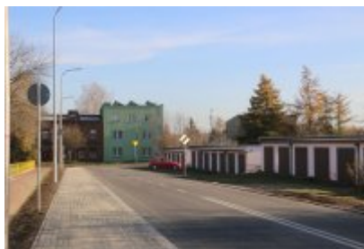
Obwodnica osiedla Piłsudskiego w Czeladzi