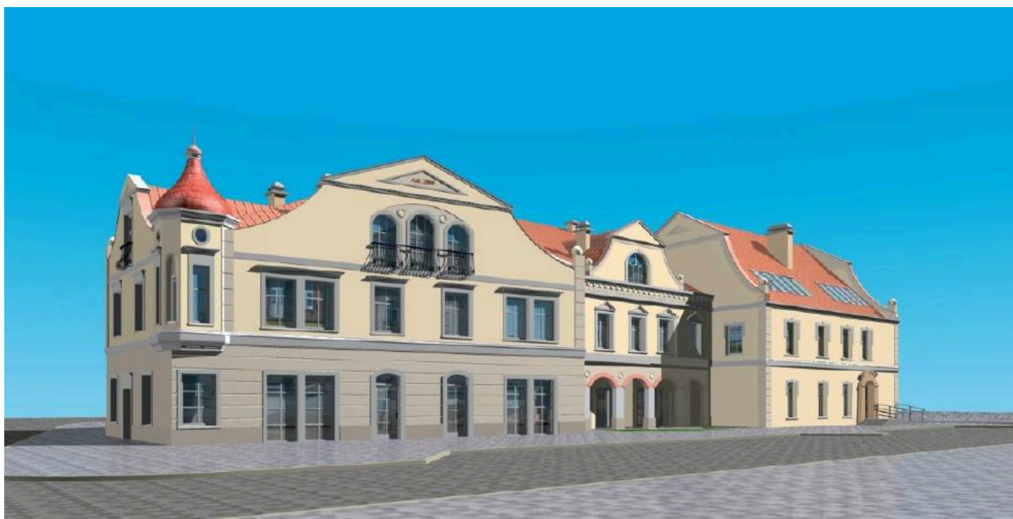
Remont kamienicy Konarzewskich przy Rynku 22 i utworzenie w niej Centrum Usług Społecznych