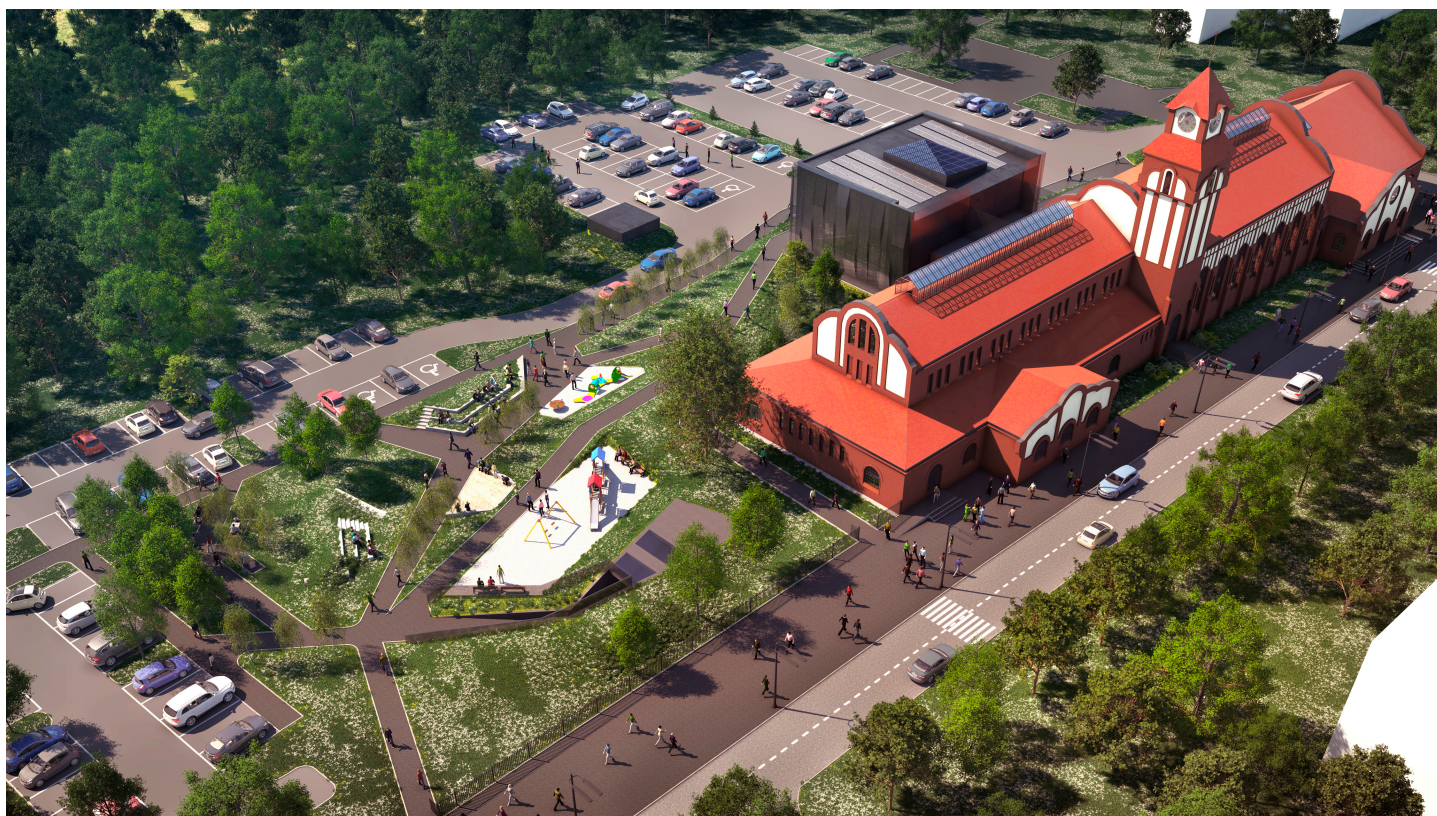
Remont budynku cechowni byłej kopalni „Saturn” i utworzenie w nim Postindustrialnego Centrum Dziedzictwa Górniczego Węglowego

Miasto Czeladź złożyło wniosek do Urzędu Marszałkowskiego o dofinansowanie ze środków RPO WSL na lata 2014-2020 inwestycji polegającej na przebudowie dawnej cechowni, łaźni, szatni i części administracyjnej KWK „Saturn” oraz adaptacji tego budynku na Postindustrialne Centrum Dziedzictwa Górniczego Węglowego w Zagłębiu Dąbrowskim.