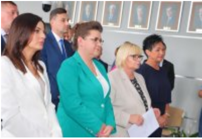
• Pierwsza sesja Rady Miejskiej w Czeladzi w kadencji 2024-2029