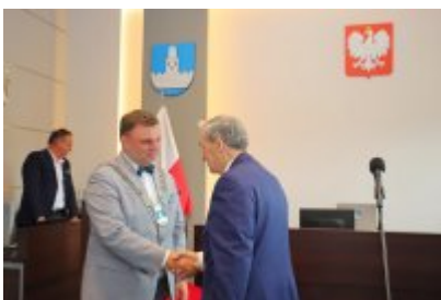
Pierwsza sesja Rady Miejskiej w Czeladzi w kadencji 2024-2029