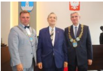
Pierwsza sesja Rady Miejskiej w Czeladzi w kadencji 2024-2029