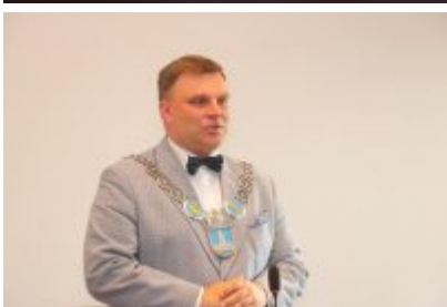
• Pierwsza sesja Rady Miejskiej w Czeladzi w kadencji 2024-2029