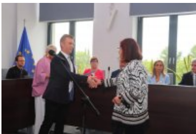
• Pierwsza sesja Rady Miejskiej w Czeladzi w kadencji 2024-2029