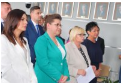
• Pierwsza sesja Rady Miejskiej w Czeladzi w kadencji 2024-2029