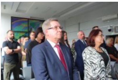
• Pierwsza sesja Rady Miejskiej w Czeladzi w kadencji 2024-2029