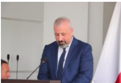
Pierwsza sesja Rady Miejskiej w Czeladzi w kadencji 2024-2029