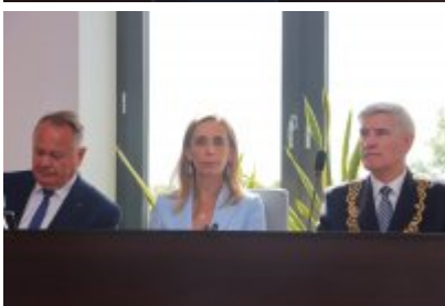
• Pierwsza sesja Rady Miejskiej w Czeladzi w kadencji 2024-2029