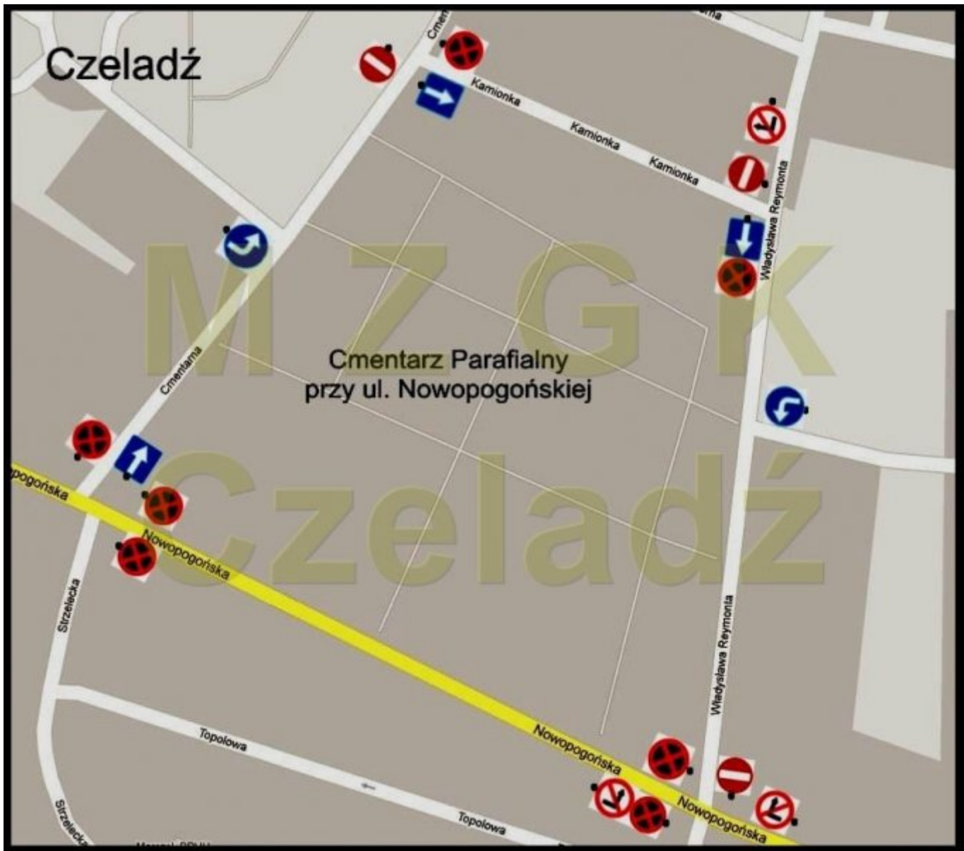
Cmentarz przy ul. Nowopogońskiej