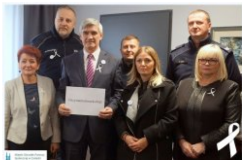
Kampania "Białej Wstążki" w Czeladzi

Miasto Czeladź w tym roku po raz pierwszy przystąpiło do Międzynarodowej Kampanii Biała Wstążka odbywającej się w ramach 16 dni przeciw przemocy wobec kobiet.