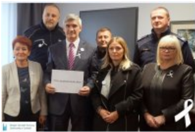
• Kampania "Białej Wstążki"