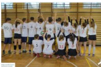
Kampania "Białej Wstążki"