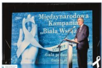
Kampania "Białej Wstążki"