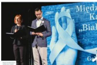
Kampania "Białej Wstążki"