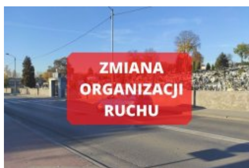
Zmiana organizacji ruchu

Zbliża się dzień Wszystkich Świętych. W związku z tym, 1 listopada, w rejonie cmentarzy w Czeladzi nastąpi zmiana organizacji ruchu. Prosimy o zapoznanie się z przygotowanymi zmianami i zachowanie szczególnej uwagi podczas poruszania się w tych rejonach.