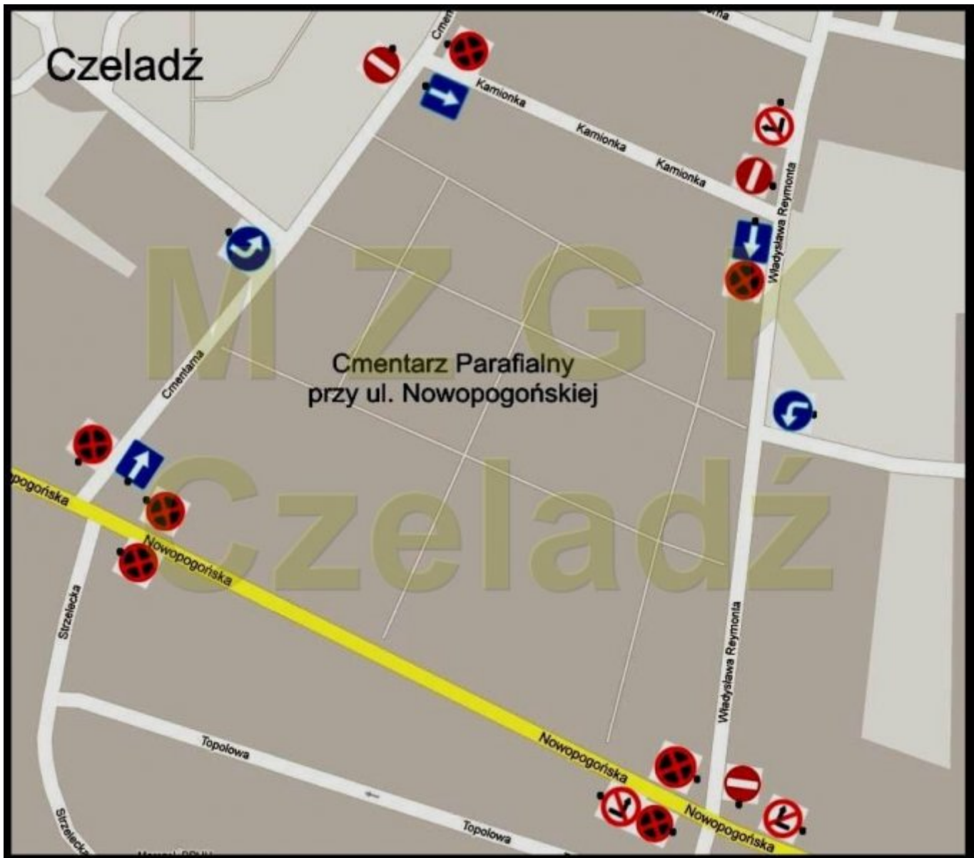
Cmentarz przy ul. Nowopogońskiej