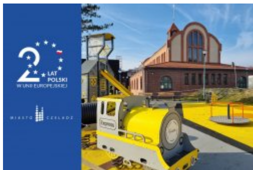
Majówka na Saturnie

1 maja świętujemy 20. rocznicę przystąpienia Polski do Unii Europejskiej! Z tej okazji zapraszamy na wyjątkowe wydarzenie, którym niewątpliwie będzie „Majówka na Saturnie”!