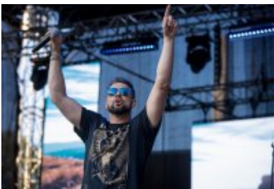
Dni Czeladzi 2023