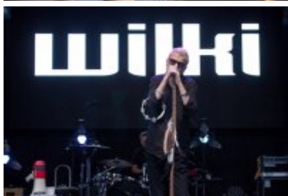
Dni Czeladzi 2023