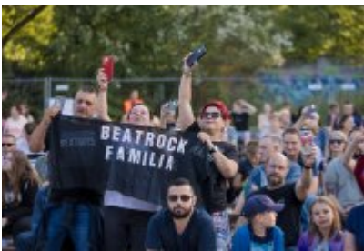
Dni Czeladzi 2023