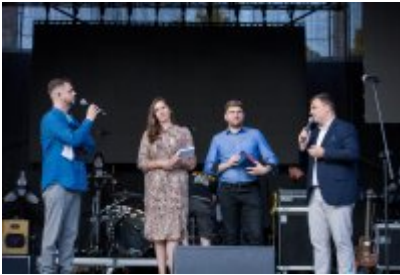
Dni Czeladzi 2023