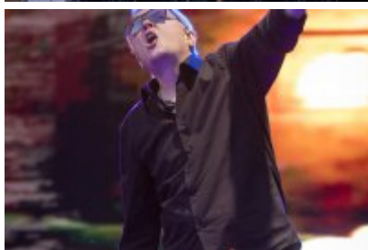
Dni Czeladzi 2023