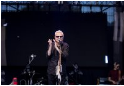
Dni Czeladzi 2023