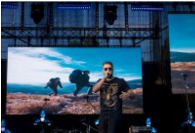
Dni Czeladzi 2023