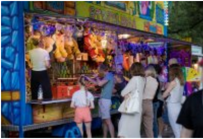
Dni Czeladzi 2023