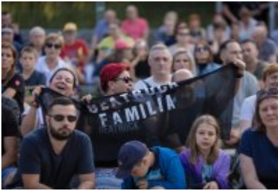
Dni Czeladzi 2023