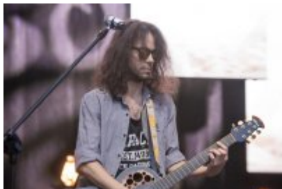
Dni Czeladzi 2023