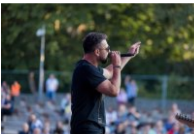
Dni Czeladzi 2023