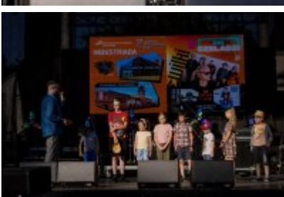
Dni Czeladzi 2023