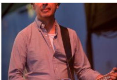
Dni Czeladzi 2023