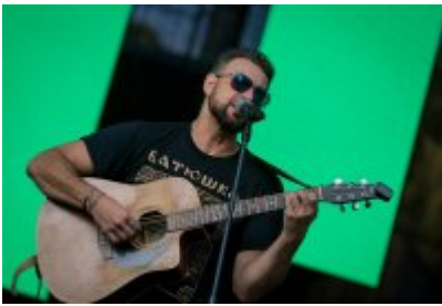
Dni Czeladzi 2023