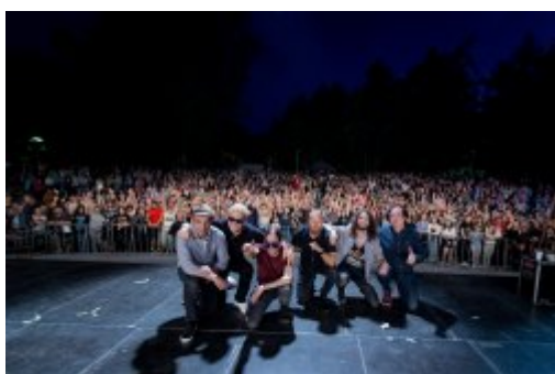
Dni Czeladzi 2023

Tegoroczne Dni Czeladzi były wyjątkowe nie tylko ze względu na artystów, którzy pojawili się na scenie. Świętowaliśmy w dwóch lokalizacjach, mieszkańcy mogli m.in. obejrzeć wnętrza wyremontowanej Cechowni oraz zacząć korzystać z Mediateki.