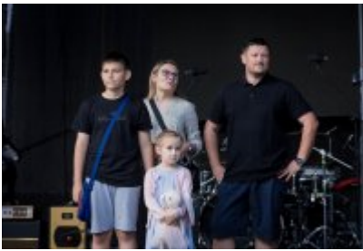
Dni Czeladzi 2023