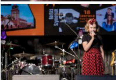
Dni Czeladzi 2023