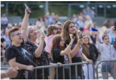
Dni Czeladzi 2023