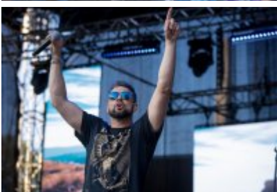
Dni Czeladzi 2023