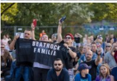
Dni Czeladzi 2023