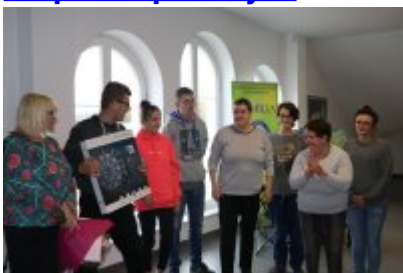
• Wernisaż X Czeladzkich Spotkań Plenerowych Osób