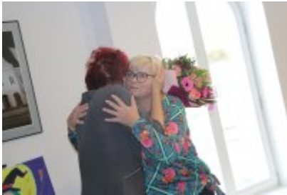
• Wernisaż X Czeladzkich Spotkań Plenerowych Osób