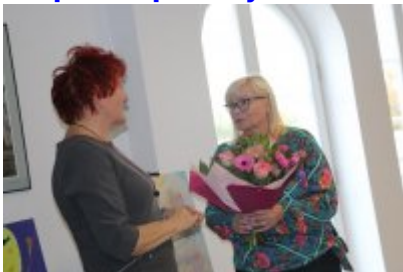
• Wernisaż X Czeladzkich Spotkań Plenerowych Osób