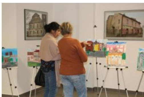
Czeladzkie Spotkania Plenerowe